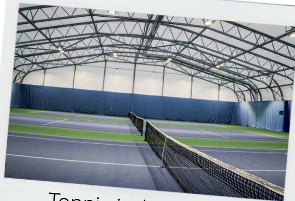
Tennis indoor court