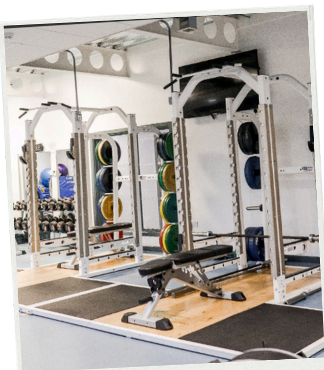
Haxby Rd Gym

Por otro lado, Haxby Road es el campus de deportes de la universidad.