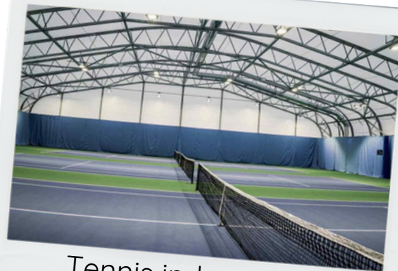
Tennis indoor court